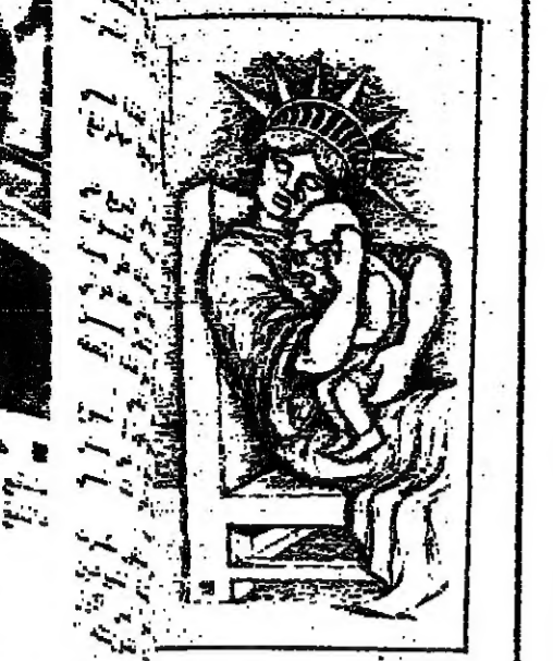
أميركا البكية (تتمتع الحرية) تحتضن ابنها الحزين كينسجر

هناك شيء يدعو إلى التساؤل في موقف كينسجر ، فبعد أقل من سنة تودي به « ساحر السلام » ثم كان عليه أن يواجه خلال أيامه أسابيع ركبا غير عادي من الضغوطات أو الترهيب ، فاستجابته سلبية على ما يبدو ، فاستجابته سلبية على ما يبدو ، فاستجابته سلبية على ما يبدو ..